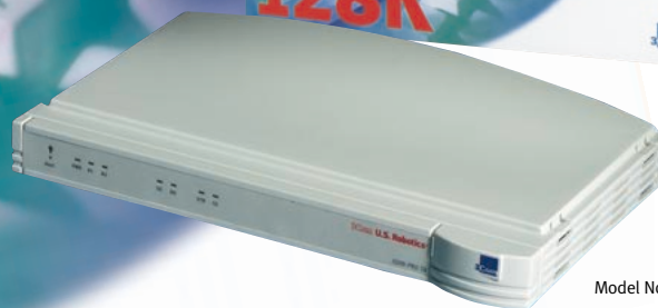
Model No. 3469