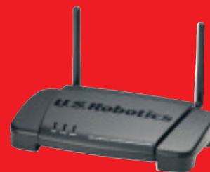
Wireless Turbo Multi-Function Access Point – Modell USR805450