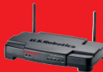
Wireless Turbo Access Point & Router – Modell USR808054

Die 802.11g Wireless Turbo Netzwerkprodukte von U.S. Robotics bieten umfassende Lösungen. Wir sind sicher, dass unsere einfach zu installierenden Produkte auch Ihren speziellen Netzwerkanforderungen entsprechen.