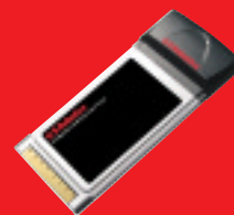
Wireless Turbo PC Card – Modell USR805410