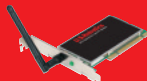
Wireless Turbo PCI Adapter – Modell USR805416