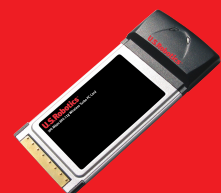
Wireless Turbo PC Card – Modell USR805410