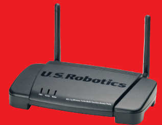
Wireless Turbo Multi-Function Access Point – Modell USR805450