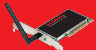
Wireless Turbo PCI Adapter – Modell USR805416