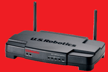
Wireless Turbo Access Point & Router – Modell USR808054

Die 802.11g Wireless Turbo Netzwerkprodukte von U.S. Robotics bieten umfassende Lösungen. Wir sind sicher, dass unsere einfach zu installierenden Produkte auch Ihren speziellen Netzwerkanforderungen entsprechen.