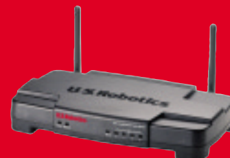
Wireless Turbo Access Point & Router, modelo USR8054

Los productos para red de U.S. Robotics 802.11g Wireless Turbo le proporcionan una solución completa y eficaz de fácil instalación que se adapta a los requisitos de su red.