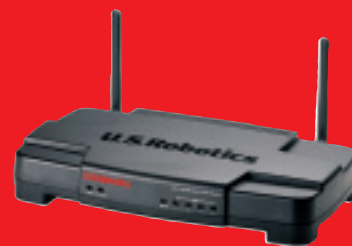
Устройство Wireless Turbo Access Point & Router – Модель 8054/5450

Сетевые продукты U.S. Robotics 802.11g Wireless Turbo предлагают комплексное решение. Наш простой в установке пакет продуктов позволит удовлетворить любые потребности сети.