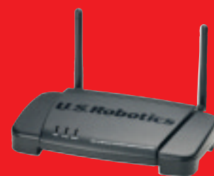
Wireless Turbo Multi-Function Access Point – Modell USR805450