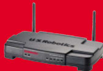
Wireless Turbo Access Point & Router, modelo USR8054

Los productos para red de U.S. Robotics 802.11g Wireless Turbo le proporcionan una solución completa y eficaz de fácil instalación que se adapta a los requisitos de su red.