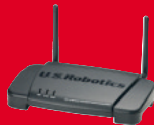
Wireless Turbo Multi-Function Access Point, modelo USR5450