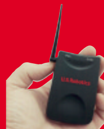
Wireless Turbo USB Adapter – Modelo USR1120