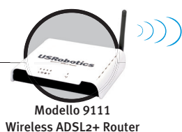
Modello 9111 Wireless ADSL2+ Router