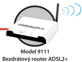
Model 9111 Bezdrátový router ADSL2+