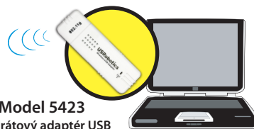
Model 5423 Bezdrátový adaptér USB