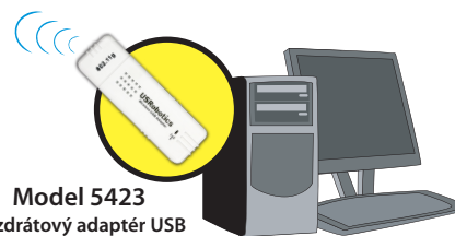
Model 5423 Bezdrátový adaptér USB