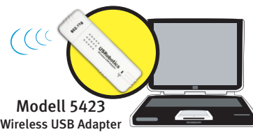
Modell 5423 Wireless USB Adapter