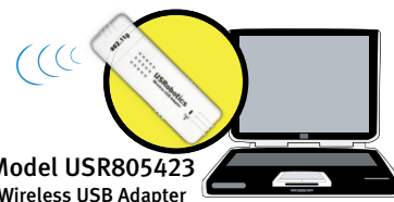
Model USR805423 Wireless USB Adapter