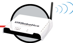
Model USR809111 Wireless ADSL2+ Router