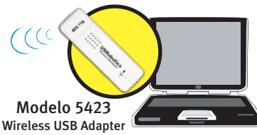
Modelo 5423 Wireless USB Adapter