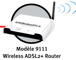
Modèle 9111 Wireless ADSL2+ Router