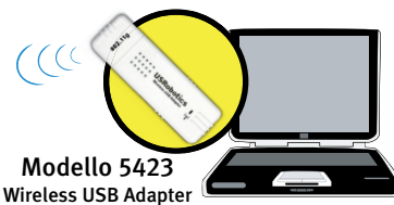
Modello 5423 Wireless USB Adapter