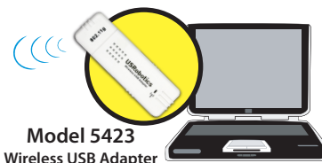
Model 5423 Wireless USB Adapter