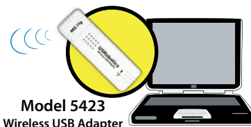
Model 5423 Wireless USB Adapter