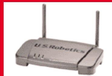
Wireless Turbo Multi-Function Access Point – Modèle USR805450