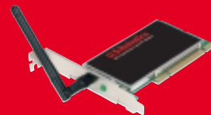
Wireless Turbo PCI Adapter – Modèle USR805416