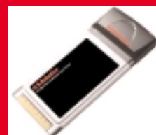
Wireless Turbo PC Card – Modèle USR805410