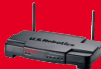
Wireless Turbo Access Point & Router – Modèle USR808054