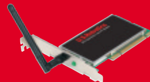
Wireless Turbo PCI Adapter, modelo USR5416