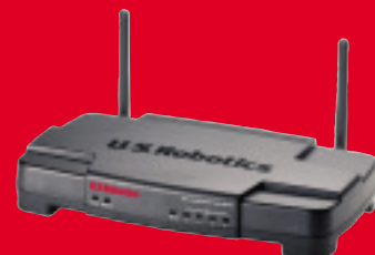
Wireless Turbo Access Point & Router, modelo USR8054

Los productos para red de U.S. Robotics 802.11g Wireless Turbo le proporcionan una solución completa y eficaz de fácil instalación que se adapta a los requisitos de su red.