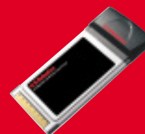
Wireless Turbo PC Card, modelo USR5410