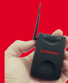
Wireless Turbo USB Adapter – Modelo USR1120