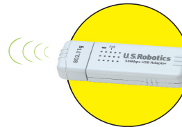
Wireless USB Adapter