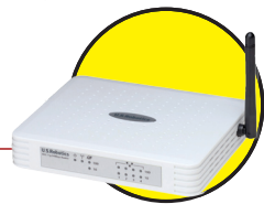
Wireless ADSL Router