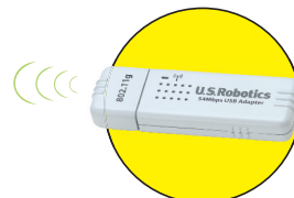
Wireless USB Adapter