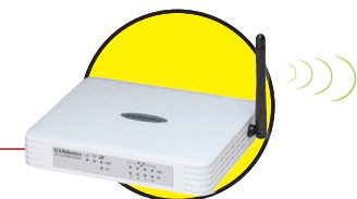
Wireless ADSL Router