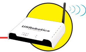
Model 9111 Bezdrtový router ADSL2+