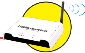
Model USR809111 Wireless ADSL2+ Router