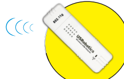
Model 5423 Wireless USB Adapter