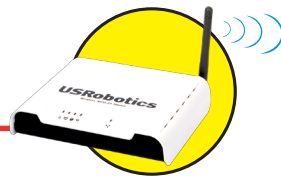
Model 9111 Wireless ADSL2+ Router