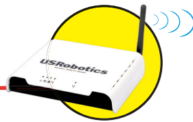
Model 9111 Wireless ADSL2+ Router