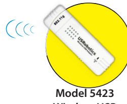
Model 5423 Wireless USB Adapter