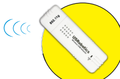
Model 5423 Wireless USB Adapter