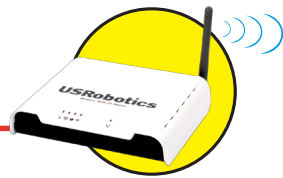
Model 9111 Wireless ADSL2+ Router