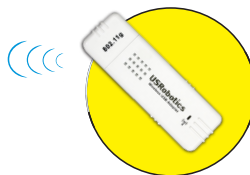
Модель 5423 Адаптер USB для беспроводной связи