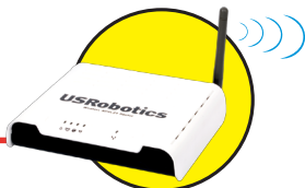
Модель 9111 Беспроводной маршрутизатор Wireless ADSL2+ Router