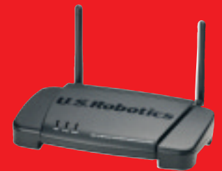
Wireless Turbo Multi-Function Access Point - Model USR805450