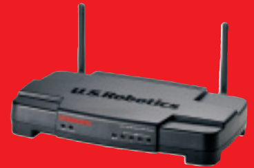
Wireless Turbo Access Point & Router - Model USR808054

U.S. Robotics 802.11g Wireless Turbo - produkty sieciowe oferujące kompletne rozwiązania. Nasza oferta prostych w instalacji produktów z pewnością spełni oczekiwania użytkowników.