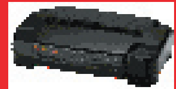
8-Port 10/100 Ethernet Switch – Modell 7908