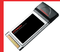
802.11g Wireless Turbo PC Card – Modell 5410