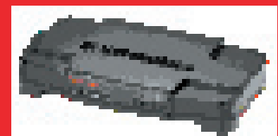
Secure Storage Router Pro – Modell 8200