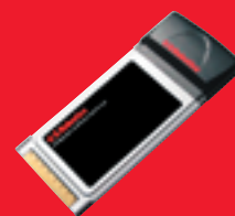
802.11g Wireless Turbo PC Card – Model 5410