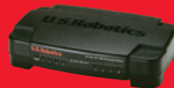
8-Port 10/100 Ethernet Switch – Model 7908