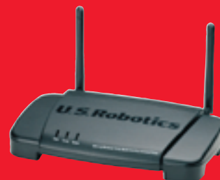
802.11g Wireless Turbo Multi-Function Access Point – Model 5450

Totale ADSL-oplossing – U.S. Robotics biedt een complete lijn snelle SureConnect ADSL-modems en routers, Ethernet-netwerkproducten en producten uit de nieuwe 802.11g Wireless Turbo-lijn. U.S. Robotics heeft alles wat u nodig hebt voor een complete, geïntegreerde ADSL-oplossing.