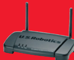
802.11g Wireless Turbo Multi-Function Access Point – Model 5450

Totale ADSL-oplossing – U.S. Robotics biedt een uitgebreide lijn snelle SureConnect ADSL-modems en routers, Ethernet-netwerkproducten en een nieuwe lijn 802.11g Wireless Turbo-producten. U.S. Robotics heeft alles wat u nodig hebt voor een complete, geïntegreerde ADSL-oplossing.