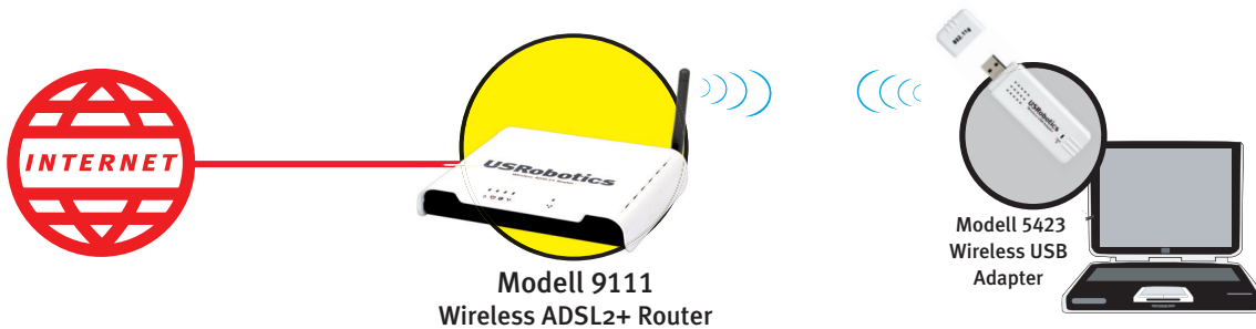
Modell 9111 Wireless ADSL2+ Router