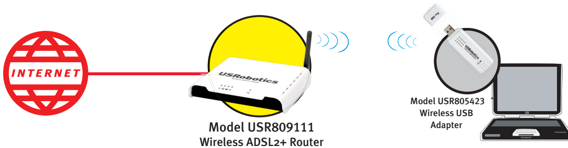
Model USR809111 Wireless ADSL2+ Router