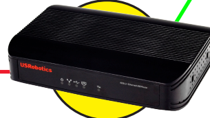
Model 819112 Router